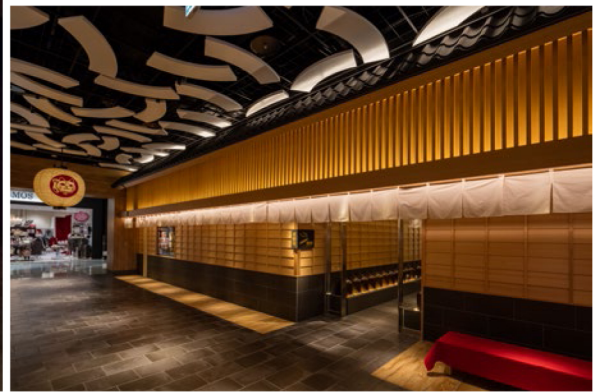
左／喫煙スペース内。正面奥には招き猫が置かれ、灰皿は橋本夕紀夫氏がデザインした、電らん管をベースにした特注品 右上／たばこを手にしたオリジナルの招き猫が迎えてくれる 右下／宿場町をデザインテーマにしたレストラン街「常滑のれん街」の共用通路から喫煙スペースのアプローチを見る